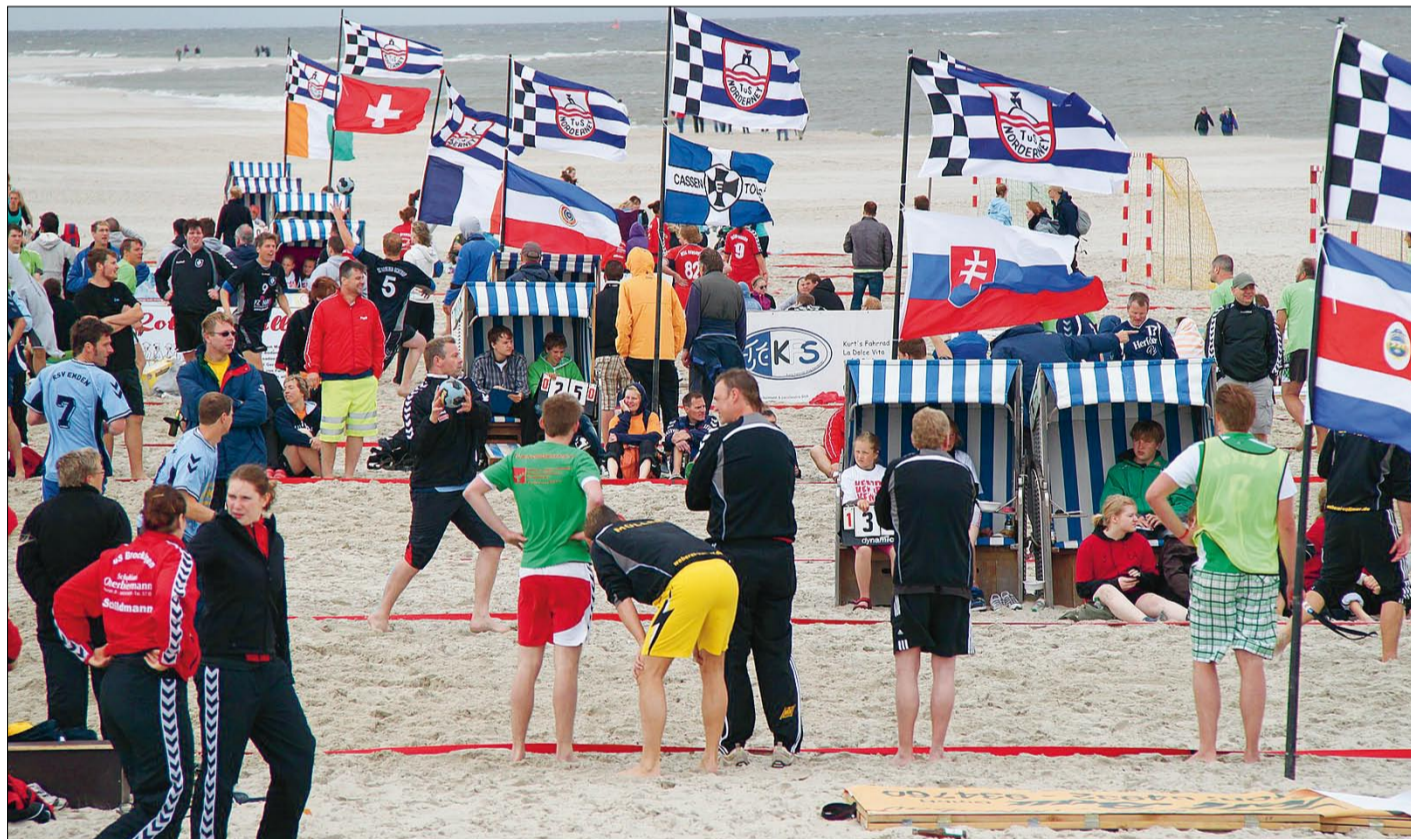
Sportplatz Weiße Düne. Auch bei der achten Auflage des Kempa-Beachhandball-Turniers freute sich der TuS Norderney über eine positive Resonanz.

Bei der weiblichen Jugend setzte sich die HSG Osnabrück im Kampf um den Cup