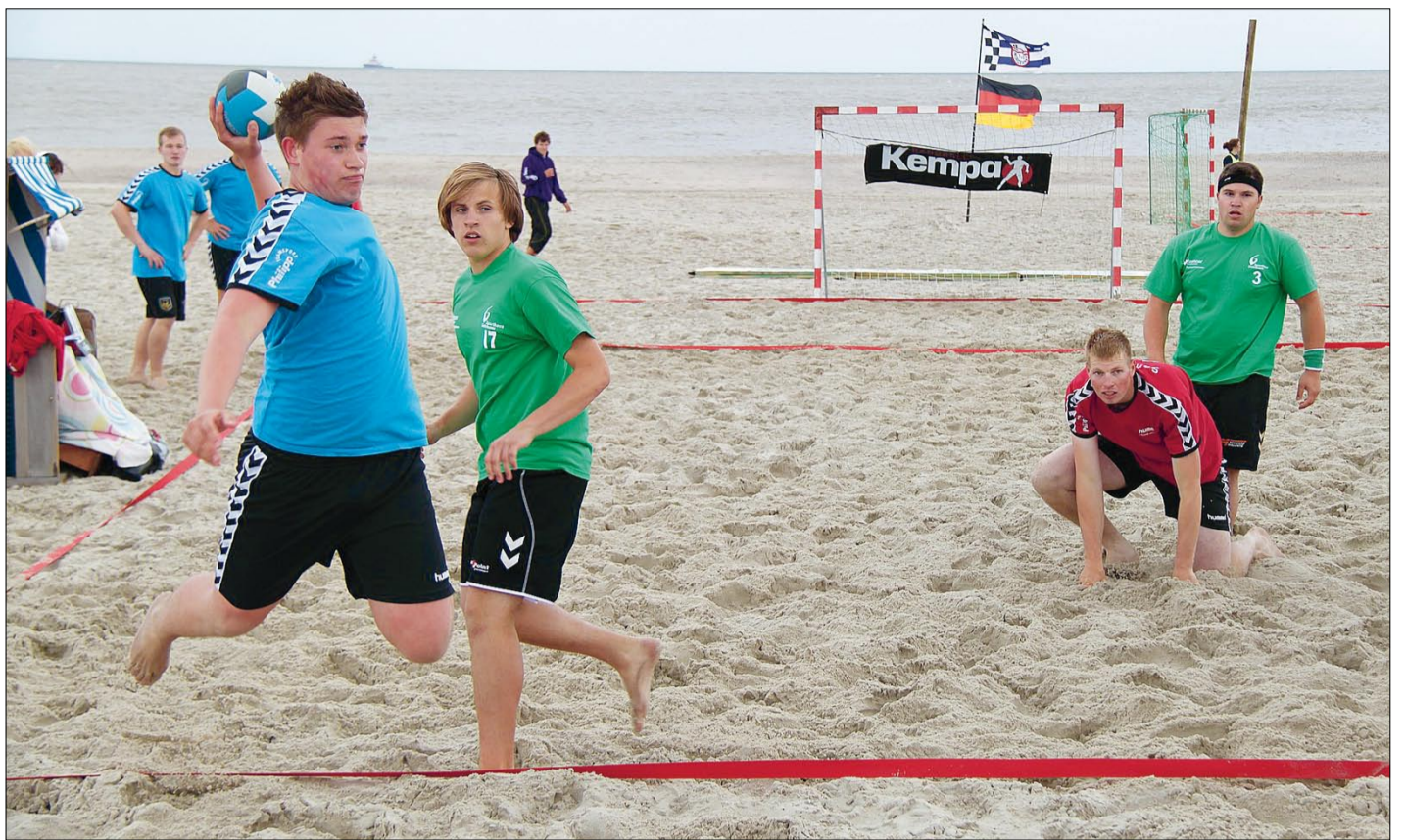
Freie Bahn. Das Beachturnier auf Norderney ist einzigartig. „Nur auf unserer Insel wird Handball am Strand gespielt“, schwärmt Organisator Klaus Wolf über die besonderen Vorzüge des Insel-Cups.